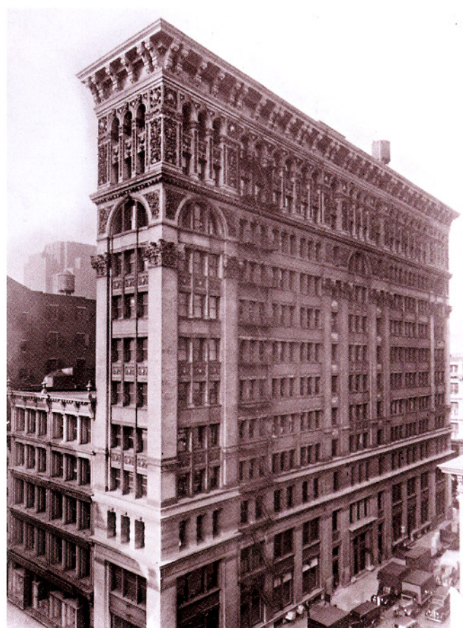
明治29年ニューヨーク支店再設置当時の事務所入居ビル