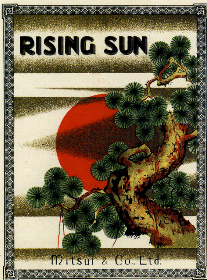
三井物産の生系商標

定価 ¥210,000 （税込） *第1期を予約特価でご購入頂いた場合は、2期・3期も予約特価が適用されます