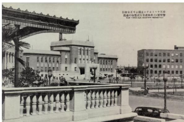
絵葉書「奉天ヤマトホテル玄関より正金銀行 警察署・三井物産等大建築物の盛観」(撮影年月不明, 愛知大学国際中国学研究センター所蔵) 手前: ヤマトホテル, 左端: 横浜正金銀行, 中央: 警察署, 右: 三井物産