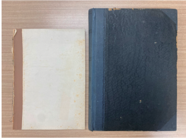
香川卓一日記 日記帳 I (左), 日記帳 II (右) 外見